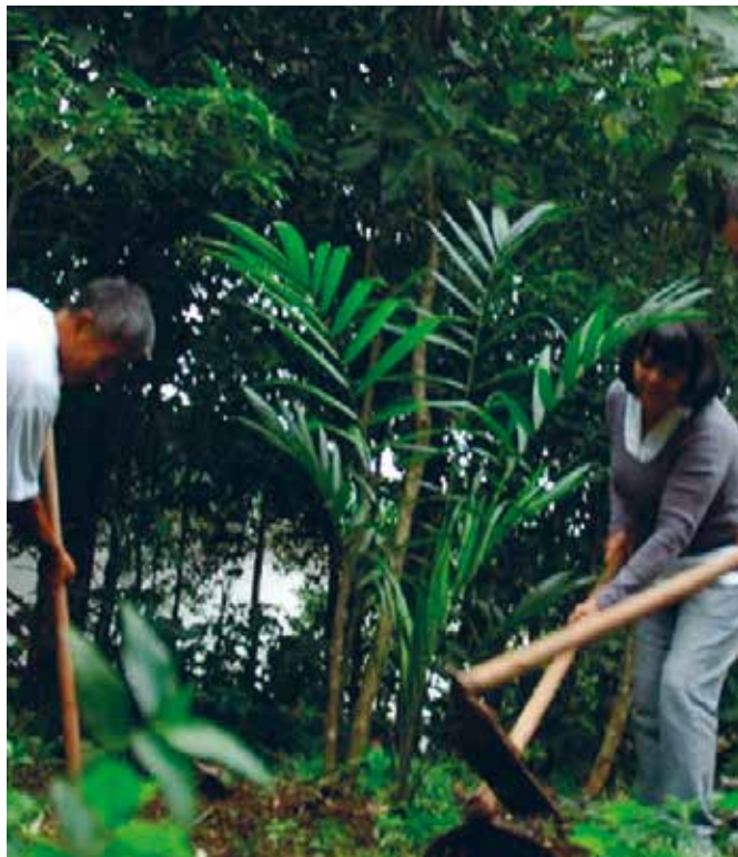
HORTA ECOLÓGICA, JARDIM BOTÂNICO DE SANTOS

A análise realizada pela equipe do Observatório Litoral Sustentável dos dados relativos à implantação do Sisan nos municípios da Baixada Santista indica que alguns já incorporaram a temática de SAN (Grupo II, veja página 16), ainda que em nenhum deles se perceba uma prática intersetorial, com programas elaborados em conjunto por diferentes secretarias. Mesmo assim, é possível diferenciá-los entre aqueles que vem avançando na execução de ações de proposição federal, estadual ou até mesmo municipal. É o caso de Itanhaém e do Guarujá, com as feiras do produtor, restaurante populares, banco de alimentos, hortas, inclusão produtiva e fortalecimento da agricultura familiar por meio das compras públicas, além de ações educativas, mesmo que pontuais. Santos também pode ser incluída nesse grupo, com a implantação de hortas ecológicas e a organização de feiras orgânicas.