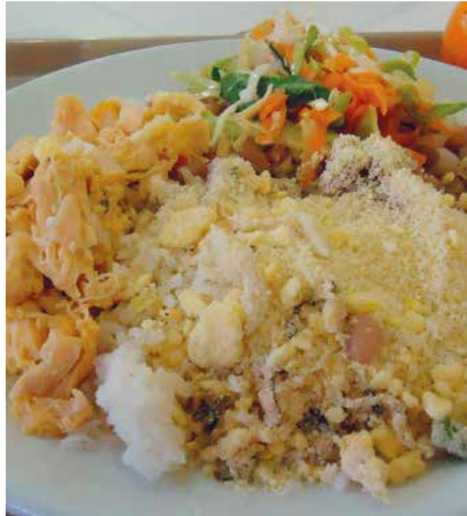
PROGRAMA SABOR E RENDA, AULA DE CULINÁRIA, GUARUJÁ