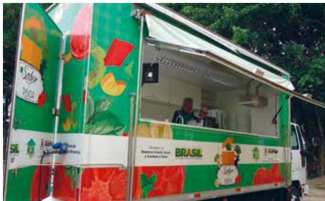
PROGRAMA SABOR E RENDA, GUARUJÁ

A Política de SAN em seus diferentes níveis de governo vem sendo concretizada por meio de uma melhor articulação da rede operacional, dos programas e das ações voltados para diferentes aspectos da segurança alimentar e nutricional, paralelamente à implementação do sistema de ação política – conselho municipal, conferência e órgão intersecretarias.