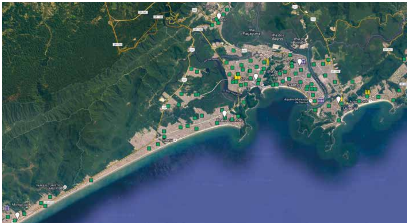
FEIRAS LIVRES, EM VERDE, E RESTAURANTES POPULARES, BANCO DE ALIMENTOS E FEIRAS DE AGRICULTORES FAMILIARES OU PESCADORES ARTESANAIS PARA VENDA DIRETA AO PÚBLICO, EM AMARELO